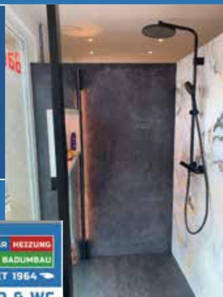
Text und Fotos: SchnellzurDusche