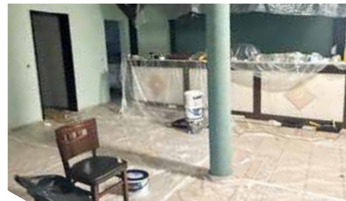
Die Renovierungsarbeiten im Vereinsheim sind bald beendet.

Aktuell laufen umfangreiche Renovierungsarbeiten im Vereinsheim. Bis zum 28. März wird das Gebäude modernisiert, um es künftig nicht besser für Vereinsaktivitäten und Vermietungen nutzen zu können. Im Zuge der Arbeiten wurde die alte Theke neu lackiert, die Wände werden frisch gestrichen und die Beleuchtung ausgetauscht. Auch viele kleine Details werden überarbeitet, damit das Vereinsheim wieder in neuem Glanz strahlt.