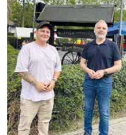
Bürgermeister Dirk Wigant besuchte das Sommerfest 2025.

Ein besonderes Highlight war im vergangenen Jahr das erste Sommerfest seit vielen Jahren. Zahlreiche Besucher kamen zusammen, um gemeinsam zu feiern. Für Kinder gab es eine Hüpfburg, Kinderschminken und eine Slush-Eis-Maschine. Auch kulinarisch wurde einiges geboten: Waffeln und Kaffee im Vereinsheim, ein Bierwagen mit verschiedenen Softdrinks und Bier sowie ein Bratwurststand auf dem Parkplatz sorgten für die passende Verpflegung. Ein besonderer Moment war der Besuch von Bürgermeister Dirk Wigant, der sich persönlich ein Bild vom wiederbelebten Vereinsheim machte.