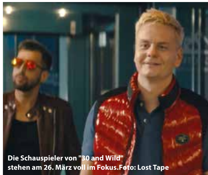
Die Schauspieler von „30 and Wild“ stehen am 26. März voll im Fokus.