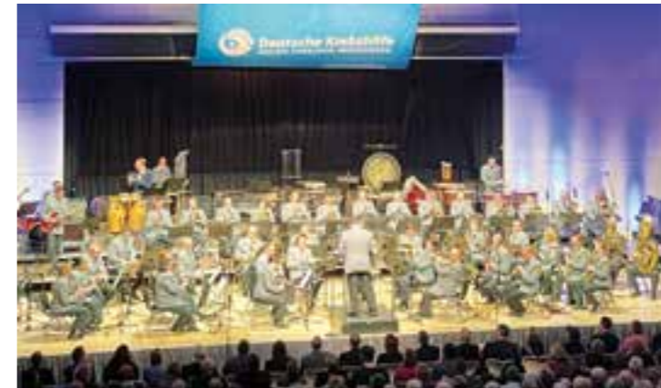
Auch die Heeresmusikkorps Kassel waren schon beim Benefizkonzert.